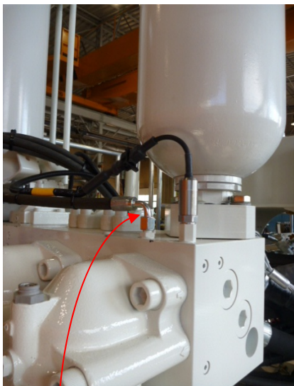
Рис 1: порт PPT

Этот метод более точен, чем метод 1. Если это возможно, мы рекомендуем пользоваться этим методом.