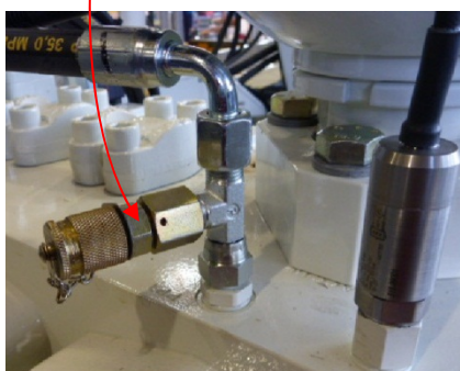
Рис 2: Тройник на порту PPT