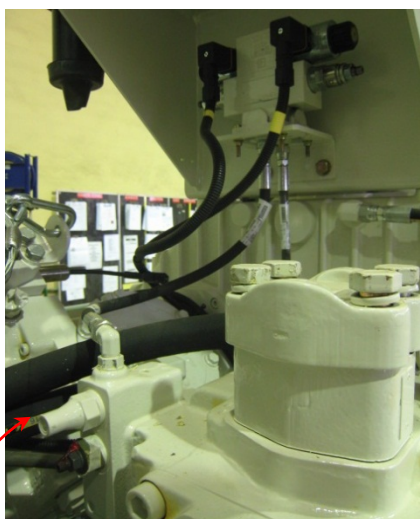
Рис 1: расположение клапана